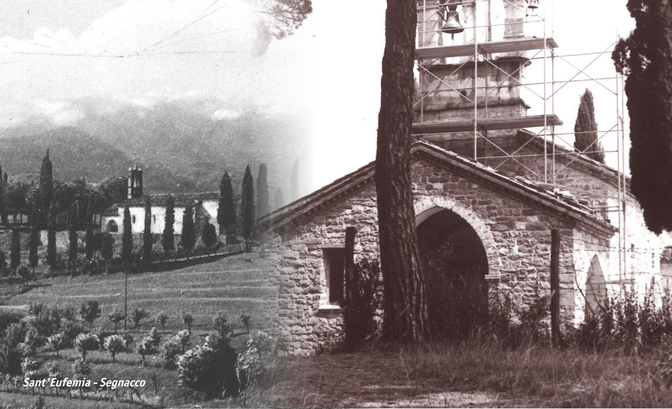
Sant'Eufemia - Segnacco